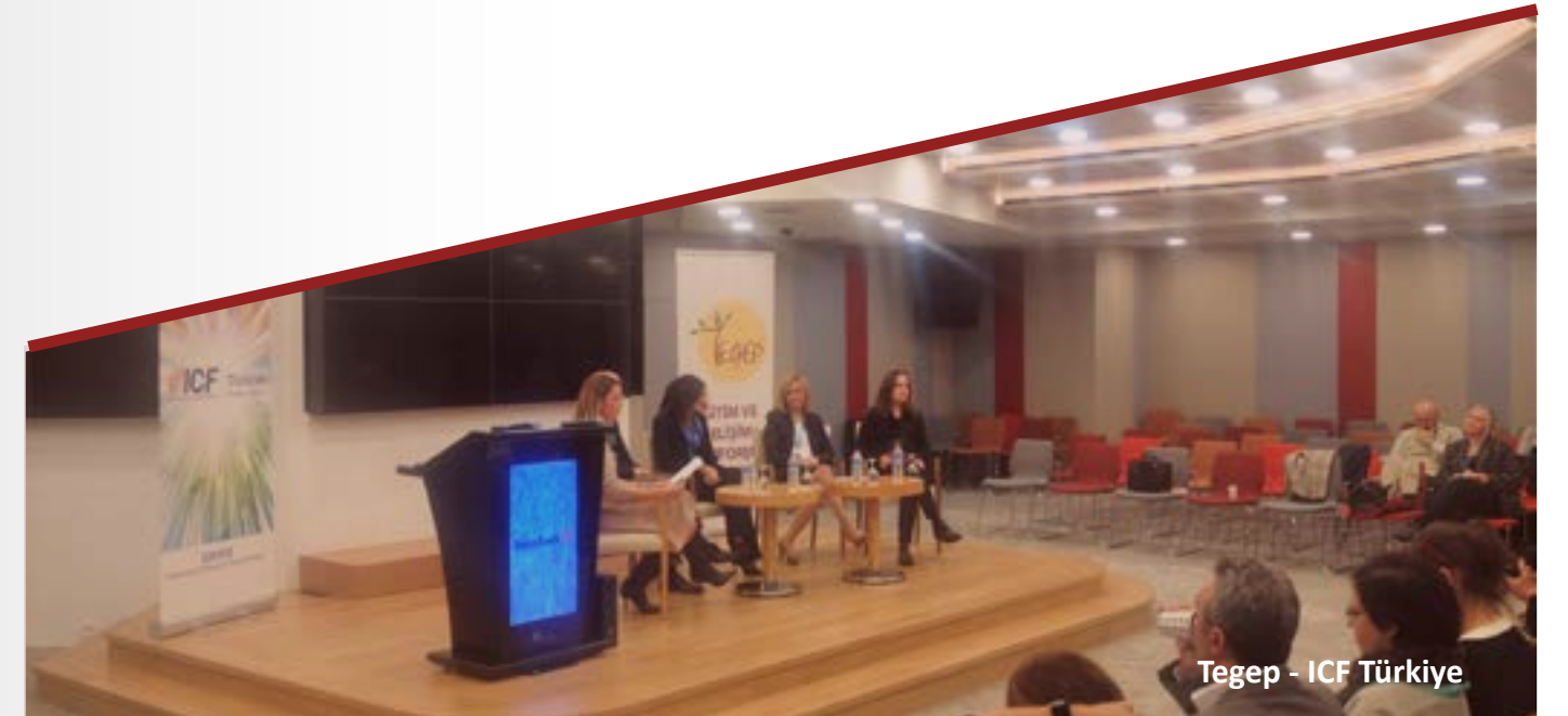
Tegep - ICF Türkiye