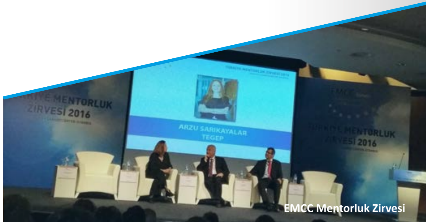
EMCC Mentorluk Zirvesi