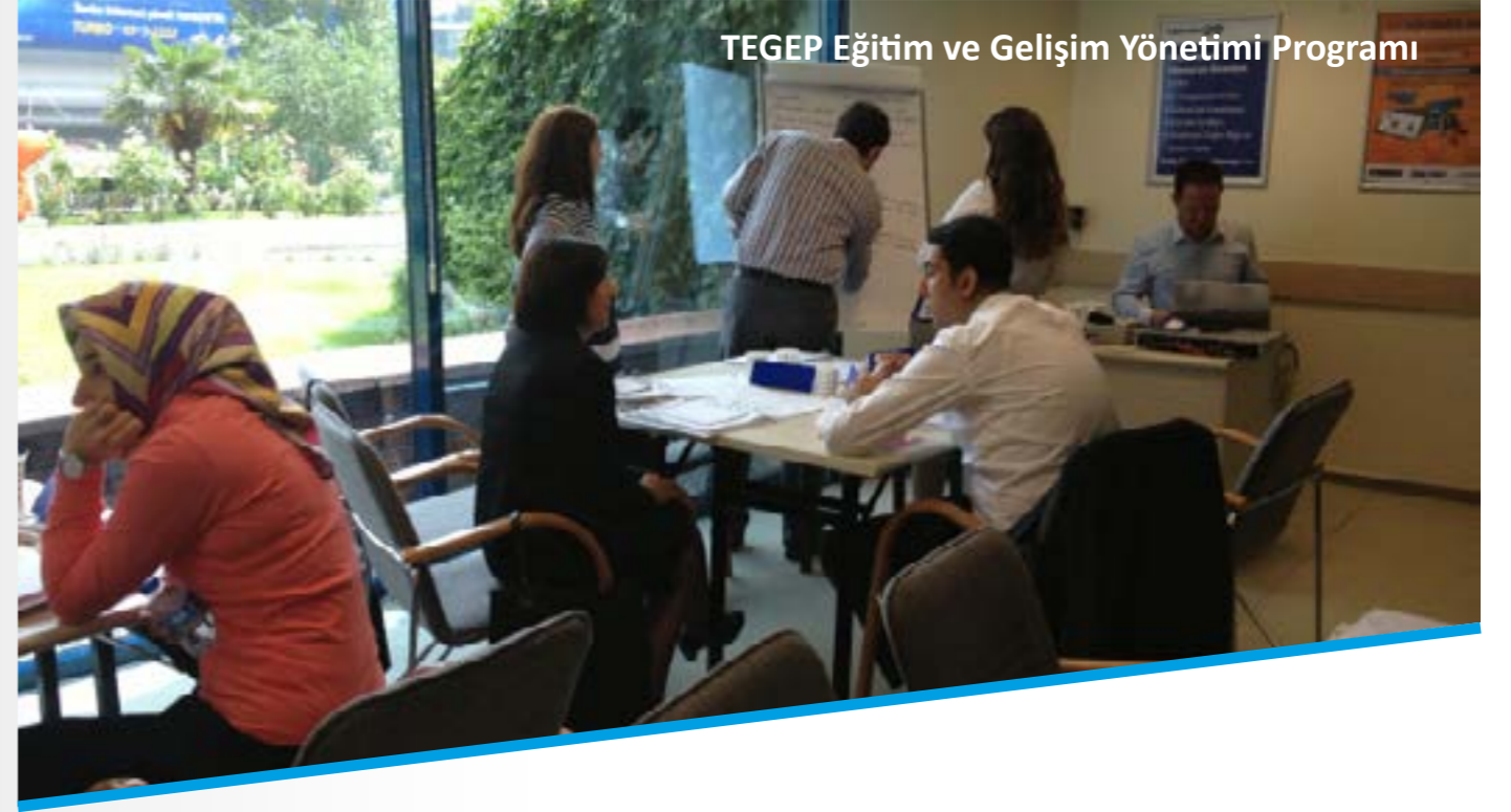
TEGEP Eğitim ve Gelişim Yönetimi Programı