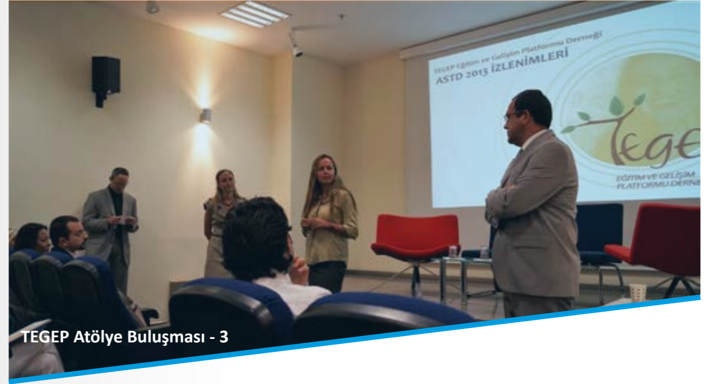
TEGEP Atölye Buluşması - 3